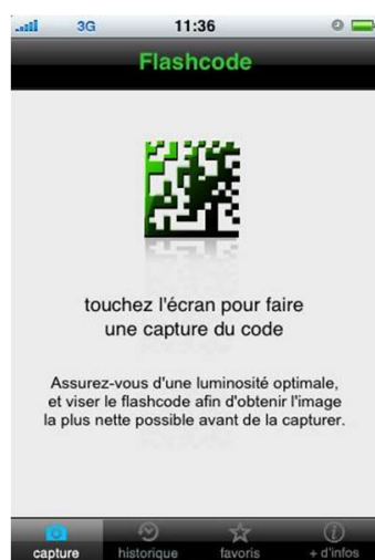
L'utilisateur lance l'application flashcode sur son Iphone.

A l'heure où de plus en plus d'attention est portée à l'Iphone, la présence de l'application flashcode sur l'AppStore était attendue par de nombreux annonceurs. Les flashcode rendent interactifs leurs supports de communication en donnant accès en un flash à du contenu, des services ou des applications mobiles. Désormais, tous les détenteurs d'Iphone (quelque soit leur opérateur) pourront à leur tour pleinement profiter de cet accès simplifié et ludique à l'Internet et aux applications mobiles.