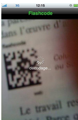
Il flashe un code barre 2D flashcode sur le livre « Le sens des choses » de Jacques Attali