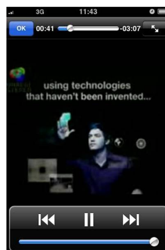
Il est immédiatement redirigé vers une vidéo illustrant les propos de l'auteur

L'application gratuite flashcode est également disponible sur l' Android market et peut donc être téléchargée sur tous les terminaux équipés de l'OS Android : à date, le HTC Magic, le HTC Dream, le HTC Hero et le Samsung Galaxy.